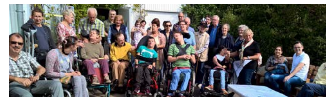
Sommerfest 2016, im Park der Sinne